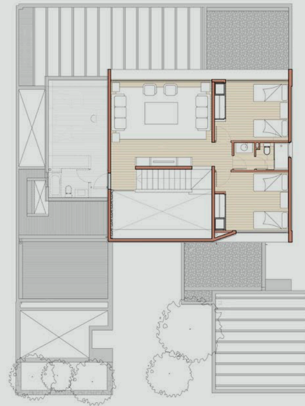
PISO 2 Superficie Total: 73,08 m 2