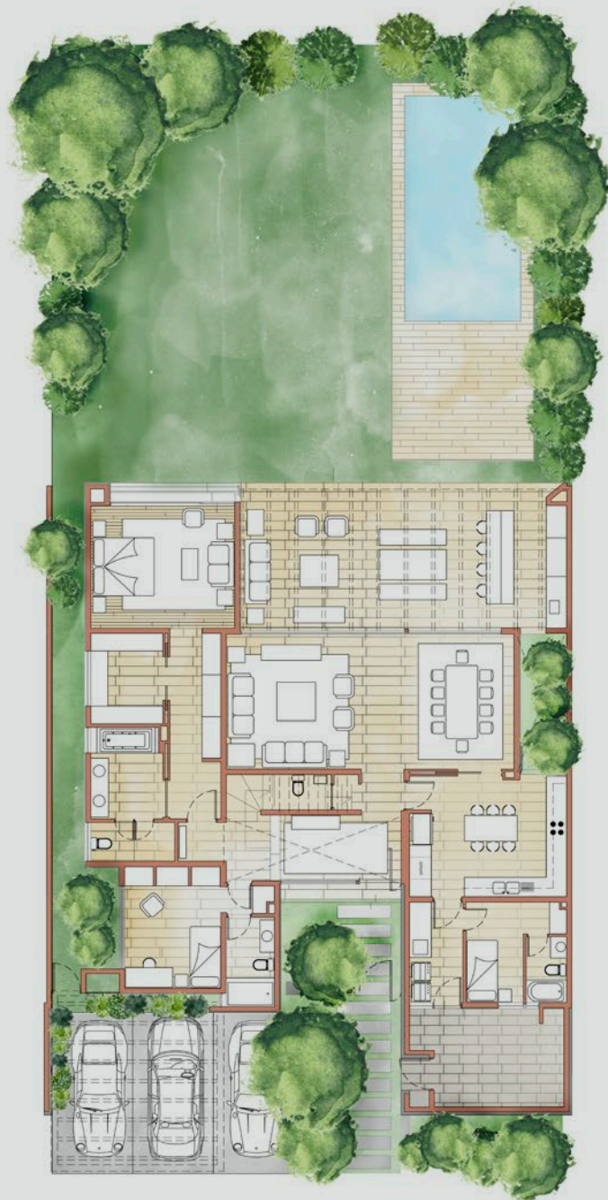
PISO 1 Superficie Total: 181,50 m 2